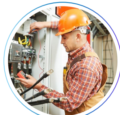
электромонтажник по силовым сетям и электрооборудованию