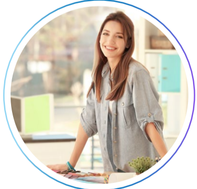
дизайнер Интерьеров и Экстерьеров