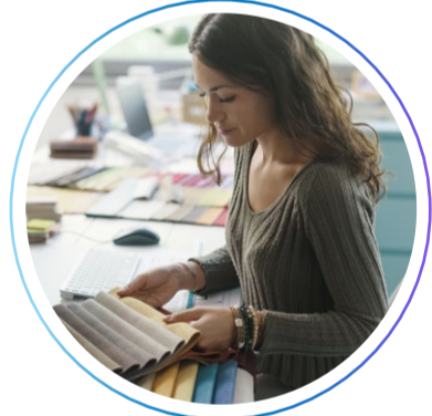
дизайнер по текстильному оформлению